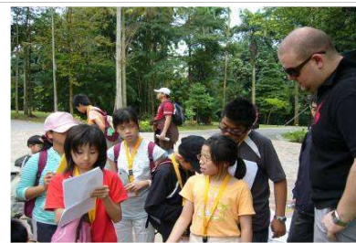
戶外教學-植物園之旅