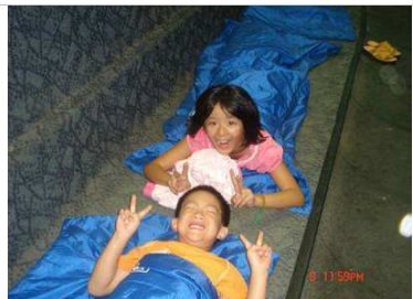
海底世界--與魚兒共眠