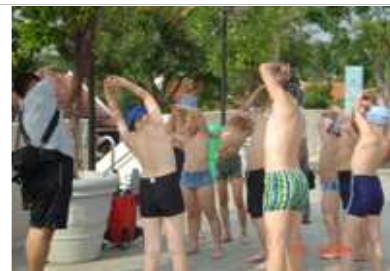
Wild Wild Wet 水上樂園