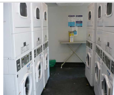
學校自助洗衣設備