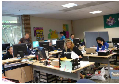
辦公室相關工作人員