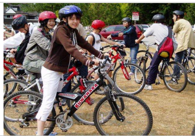
溫哥華史坦利公園騎自行車