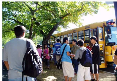
搭乘校車戶外教學